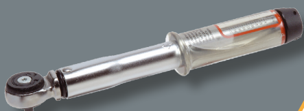
Imaginea de mai sus prezintă Norbar SLO

Norbar a fost prima companie din Marea Britanie care a fabricat chei dinamometrice la nivel comercial, iar astăzi deține cea mai extinsă gamă de instrumente de cuplu pe plan mondial.