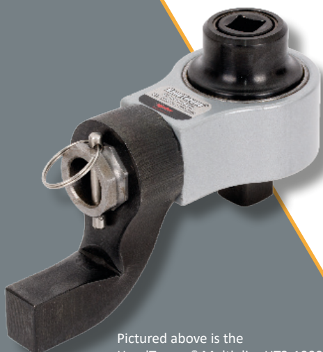
Pictured above is the HandTorque® Multiplier HT3-1000