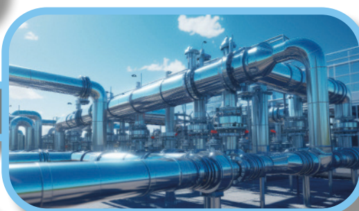
Petrol & Gaze