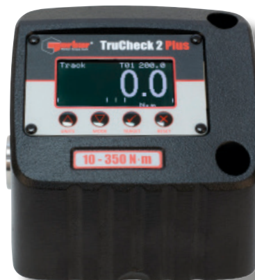
Norbar TruCheck™2, 350 N·m

Discutați cu experții noștri pentru a înțelege cum putem face diferența pentru afacerea dvs. și pentru procesele care utilizează instrumente prevăzute cu controlul cuplului.