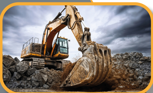
Minerit & Rafinare