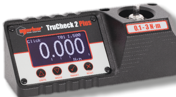
Norbar TruCheck™2, 3 N·m

Ideal pentru testarea șurubelnițelor dinamometrice